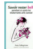
Savoir rester belle pendant et après les traitements anti-cancer Aury Caltagirone Ed. Salutaires, 2013

Un livre qui contient de très nombreux conseils utiles et pratiques en matière d'esthétique et d'image, qui aideront à pallier les effets secondaires des différents traitements médicaux.