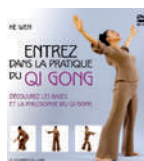
Entrez dans la pratique du Qi gong : découvrez les bases et la philosophie du Qi gong Key Wen Courrier du livre, 2009

Ce manuel de Qi gong décrit des postures pour renforcer son énergie et propose des exercices pour atteindre la conscience du souffle et l'harmonie entre le corps et l'esprit.