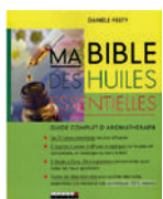
Ma bible des huiles essentielles Danièle Festy Leduc, S Editions, 2008

Ce guide, des plus complets, donne des réponses claires sur l'aromathérapie : 78 huiles essentielles les plus efficaces (arbre à thé, lavande, romarin, ylang-ylang...) ainsi qu'une trentaine d'huiles végétales y sont décrites pour votre santé, votre bien-être.