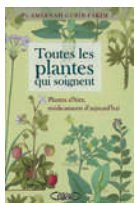
Toutes les plantes qui soignent, plantes d'hier médicaments d'aujourd'hui Ameenah Gurib-Fakim Lafon, 2008

Ce guide, des plus complets, donne des réponses claires sur l'aromathérapie : 78 huiles essentielles les plus efficaces (arbre à thé, lavande, romarin, ylang-ylang...) ainsi qu'une trentaine d'huiles végétales y sont décrites pour votre santé, votre bien-être.